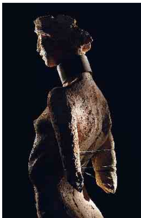
Qui sopra “Ancilla Domini” (2009) e, a sinistra, “Thyestes” (2009)

Riportiamo un brano tratto dall'introduzione del volume