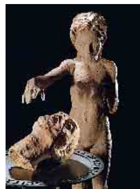
Da sinistra: “Crucifixio” (2009) in cui è particolarmente messa in risalto la tecnica scultorea di Zucconi; la copertina del libro e “Salomé” (2008)